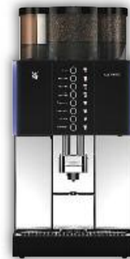
Uitvoering met 2 molens, Twinchoc, 8 voorkeurstoetsen.