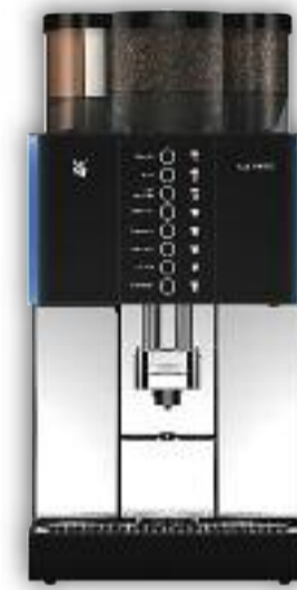
Uitvoering met 2 molens, Twintopping, 8 voorkeurstoetsen.