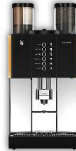
Uitvoering met 1 molen, Twinchoc, 6 voorkeurstoetsen.