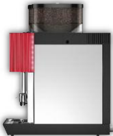
Uitvoering met 2 molens, Choc, 8 voorkeurstoetsen.