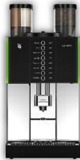
Uitvoering met 1 molen, Twintopping, 8 voorkeurstoetsen.