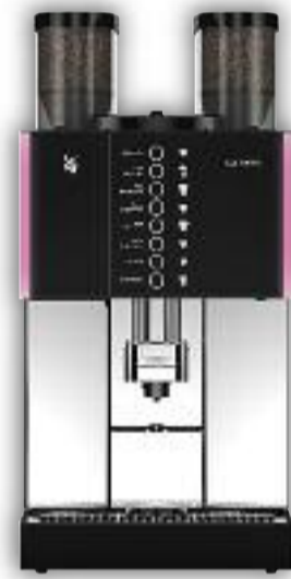
Uitvoering met 1 molen (links inactief) of 2 molens, 8 voorkeurstoetsen.

Het bewezen modulaire design zorgt ervoor dat de WMF 1800 S overal op zijn plaats staat. De machine kan naar wens worden uitgevoerd met een of twee koffiemolens en met Choc- of Melktopping, Twinchoc of Twintopping. Een extra zekerheid voor het zelfbedieningsgebruik is dat alle reservoirs afsluitbaar zijn.