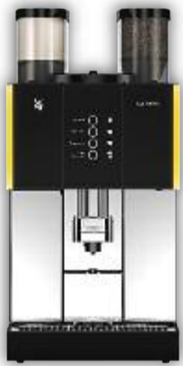
Uitvoering met 1 molen, Melktopping, 4 voorkeurstoetsen.