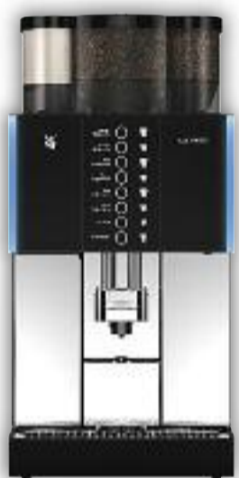
Uitvoering met 2 molens, Melktopping, 8 voorkeurstoetsen.