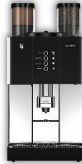
Uitvoering met 1 molen, Choc, 4 voorkeurstoetsen.